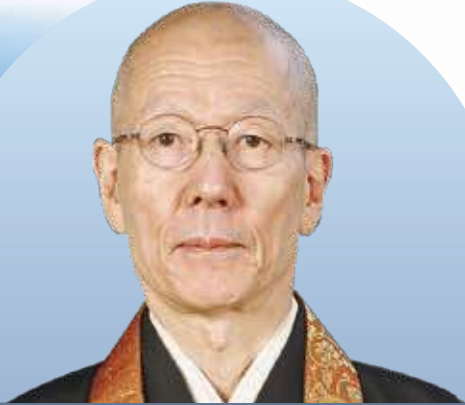
WCRP 日本委員会会長 天台宗妙法院門跡門主