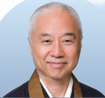
WCRP 日本委員会理事長 浄土宗総合研究所副所長・浄土宗心光院住職

現在、過剰な利己心や不寛容から生み出される憎悪によって排他・独善主義の潮流が暴力と繋がり、世界に分断と不安定な状況が生まれつつあり、このような時こそ宗教者は、誰よりも率先して対話を通じた信頼の醸成のために行動することが肝要です。本年も共に平和への歩みを前進させていきましょう。