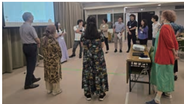
アクティビティの実演

2日目は、班ごとに実演発表を行い、和解の教育タスクフォース委員会メンバーからコメントをもらい、他の班からも良い点と建設的な改善点のコメントをもらい議論した。参加した受講生からは「グループ討議ではアイデアを具体的に描き、プログラムも時間割までイメージをもって詳細に考えられたので良い時間だった」などの感想が挙がった。